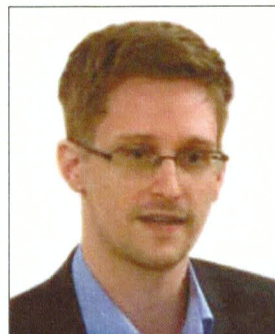
Whistleblower Edward Snowden hat von unsicheren Cloud-Diensten abgeraten. In einem Interview empfiehlt er SpiderOak .

Wuala ist der älteste verschlüsselte Cloud-Dienst, wie Tresorit eine Schweizer Gründung, gehört aber inzwischen zum ameri-